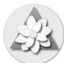
Illustration: symbole du chakra du cœur tiré du livre « Balancing the chakras » par Maruti Seidman.